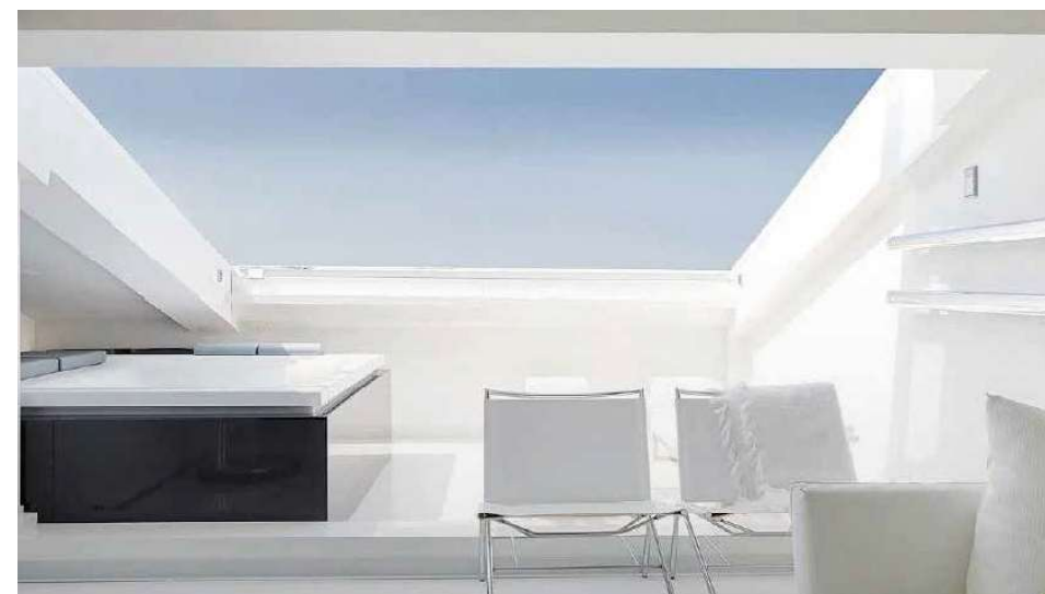
Vue en détail